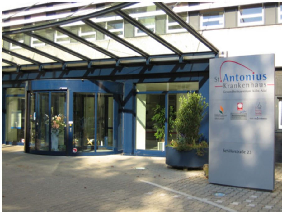
Abbildung: Foto Haupteingang des Krankenhauses